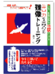
高岸弘新刊 ダイヤモンド社刊 定価1,470

1994年、残像を活用したメンタルトレーニングはプロテニスコーチの小浦武志氏と、建築家の高岸弘との間で開発され、特にメンタル面での強化が要求されるプロテニス選手達の全く新しいメンタルスキル手法として使われ始めます。その後高校野球界からプロゴルフ界、そしてソフトテニス日本代表ナショナルチーム等広がりを見せ、またビジネス界、国立東京医科歯科大学や阪急学園など幼児教育、学習の世界でも実績を上げています。