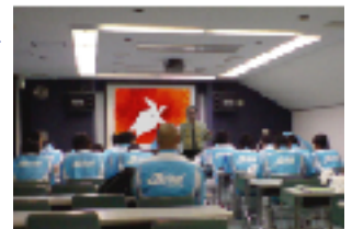
テニス日本代表チーム