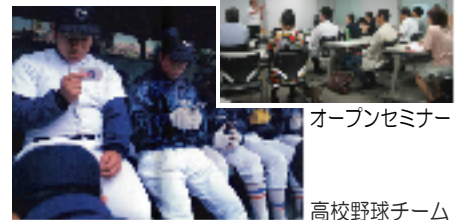
オープンセミナー